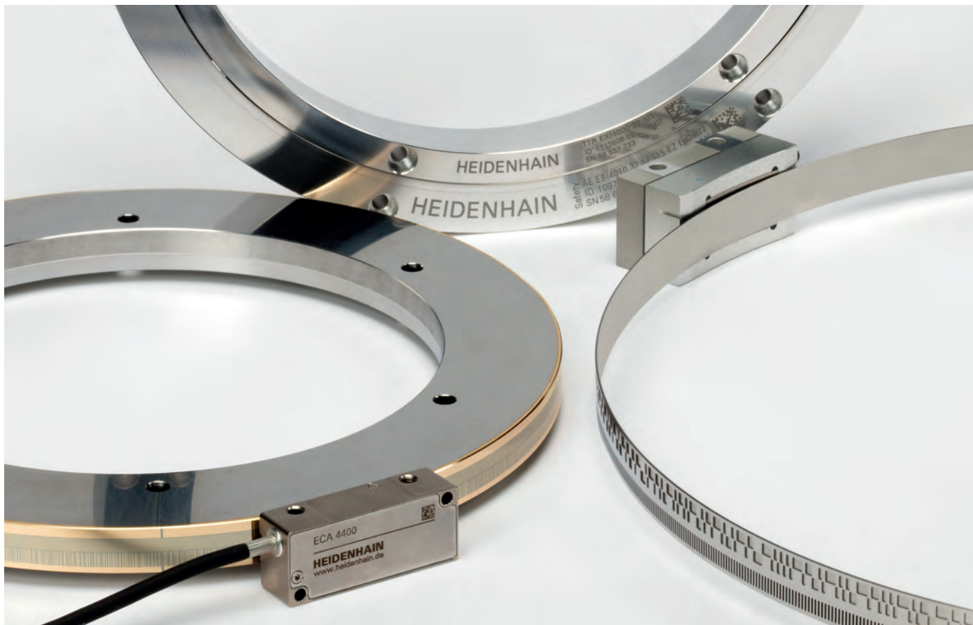
Abbildung 3: Hochgenaue HEIDENHAIN- und AMO-Messgeräte für die absolute Positionsmessung an Robotern

Für diese Anwendungen eignen sich modulare Winkelmessgeräte wie das HEIDENHAIN ECA 4000 mit optischer Abtastung, der Drehgeber HEIDENHAIN ECI 4000 mit induktiver Abtastung oder das Winkelmesssystem AMO WMR. Durch ihren modularen Aufbau mit Teilungstrommel bzw. Teilungsband und separater Abtasteinheit eignen sie sich für große Wellendurchmesser ebenso wie für schwierige Einbausituationen, wie sie in Robotern aufgrund der beengten Platzverhältnisse anzutreffen sind. Ihre Signalgüte ist deutlich besser als bei den Drehgebern am Servomotor, sodass sie wesentlich genauere Positionswerte liefern – auch bei hoch dynamischen Bewegungen.