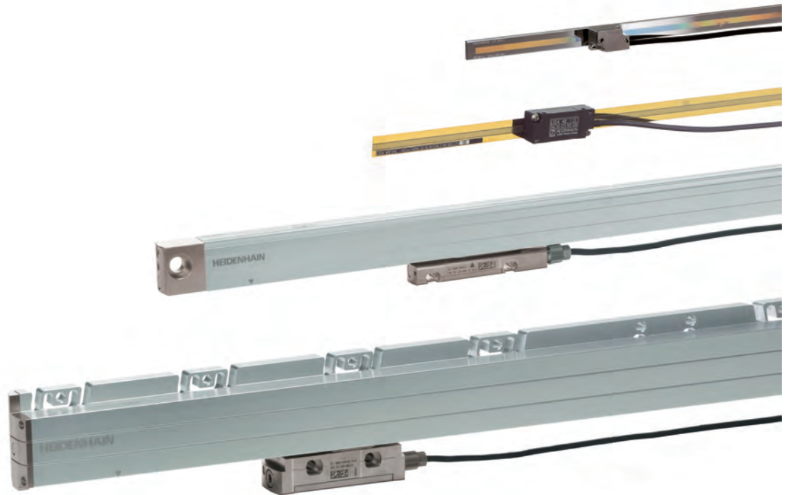
Abbildung 4: HEIDENHAIN-Längenmessgeräte