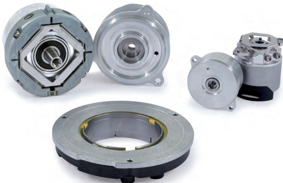
Abbildung 1: Klassische HEIDENHAIN-Drehgeber für das Motor-Feedback

Das Motorfeedback der Servomotoren an den Achsen der Roboter übernehmen weiterhin klassische Drehgeber. Da die Servomotoren eine hohe Regeldynamik erfordern, können hier beispielsweise robuste induktive Drehgeber wie die Baureihen ECI 1100 und 1300 oder Multiturn-Drehgeber der Baureihen EQI 1100 und 1300 von HEIDENHAIN eingesetzt werden. Sie bieten eine hohe Regelgüte und Systemgenauigkeit. Außerdem sind sie besonders stark mit Vibrationen belastbar. Da die Drehgeber über die rein serielle EnDat-Schnittstelle verfügen, können auch stark elektromagnetisch belastete Einsatzbereiche die Qualität und Sicherheit der Datenübertragung nicht beeinträchtigen.