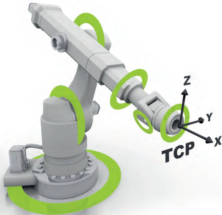
Abbildung 2: Verbesserung der absoluten Positionsgenauigkeit durch den Einsatz von sogenannten Secondary Encoders an jeder Achse

Eine signifikante Verbesserung der absoluten Positionsgenauigkeit erreichen die Roboterhersteller durch den Einsatz zusätzlicher, hochgenauer Winkelmessgeräte oder Drehgeber an jeder Roboterachse. Diese sogenannten Secondary Encoders, jeweils montiert nach dem Getriebe, erfassen die tatsächliche Position jedes Robotergelenks. So berücksichtigen sie auf jeden Fall den Nulllagenfehler und das Umkehrspiel. Außerdem messen sie an jeder Achse des Roboterarms die rückwirkenden Kräfte aus der Bearbeitung. Das führt in Summe zu einer Verbesserung der absoluten Positionsgenauigkeit am Tool Center Point um 70 Prozent bis 80 Prozent.